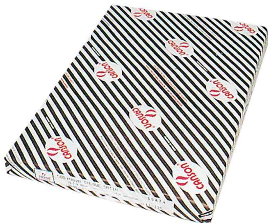
Papier calque, feuilles

• avec une surface micro-lisse pour des lignes à contours très prononcés • idéal pour l'encre de chine et les crayons • très résistant au gommage • particulièrement propice pour tous les procédés de reproduction • qualité satinée