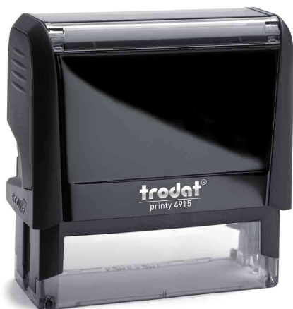
Text-Stempelautomat "Printy 4.0" 4915

Zubehör: Ersatzstempelkissen: VE = 2 Stück, Abgabe nur in ganzen VE's