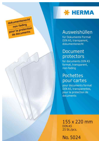
Pochettes pour cartes