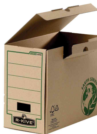
Boîte d'archives, ouverte