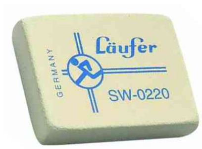
Gomme en caoutchouc naturel SW