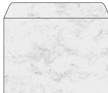
Marbré gris, DIN C5