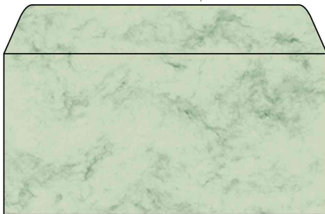
Marbré vert pastel, DL