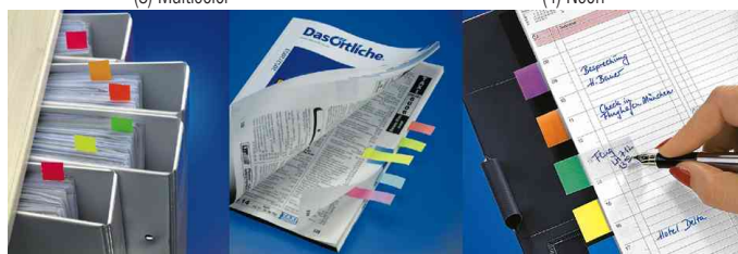
Index repositionnables, exemples d'utilisation