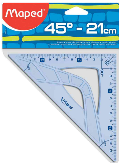
Équerre Geometric 45°