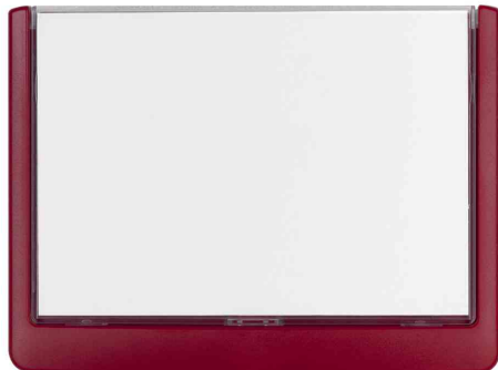
Plaques de portes Click Sign, rouge