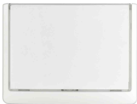
Plaques de portes Click Sign, blanc