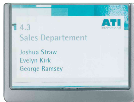
Plaques de portes Click Sign, graphite