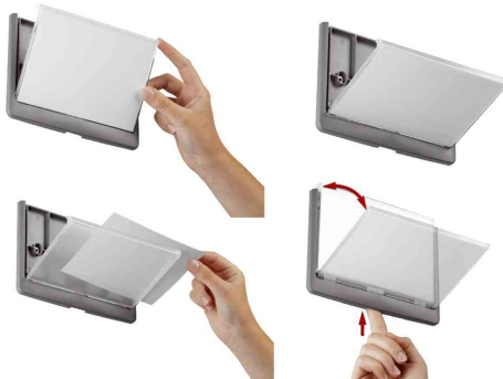
facile à remplacer