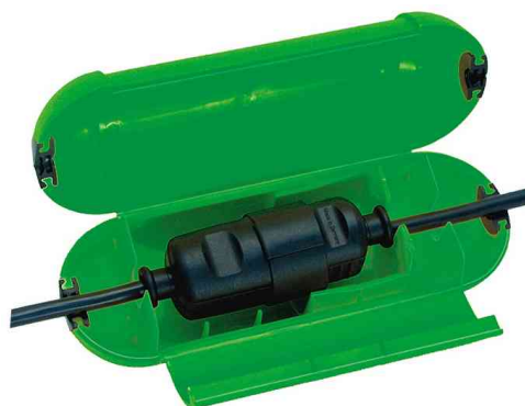
Safe Box, ouvert