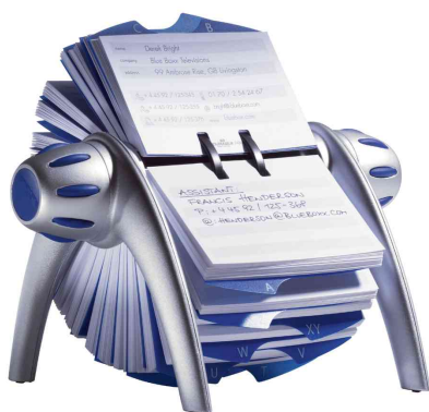
Fichier rotatif TELINDEX® flip, argent métallique / bleu

- bureaux, administrations, personnes privées