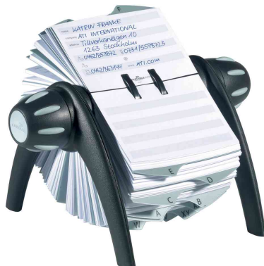
Fichier rotatif TELINDEX® flip, noir / gris