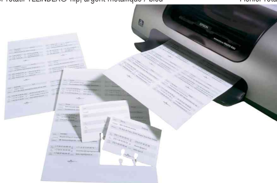
Accessoire: fichiers TELINDEX® flip, imprimable à l'ordinateur