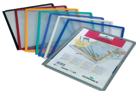
SHERPA® Plaques-pochettes, couleurs différentes