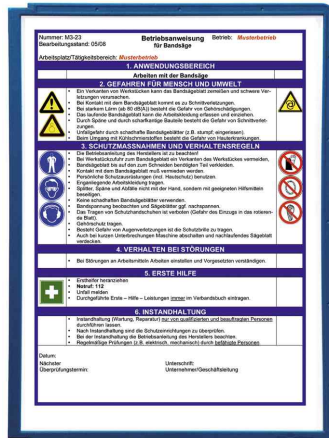
SHERPA® Plaque-pochettes, bleu foncé