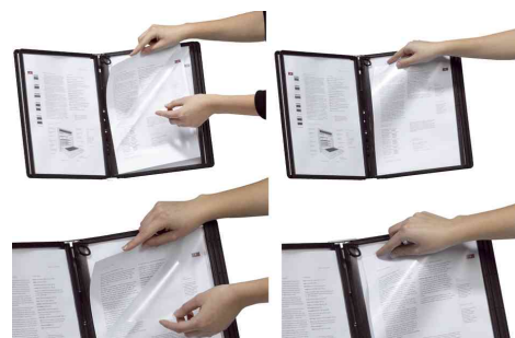
Changement rapide des informations