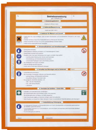
SHERPA® Plaque-pochettes, orange