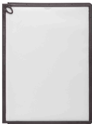
SHERPA® Plaques-pochettes Panel Plus