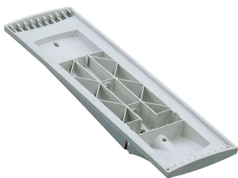
SHERPA® Support mural 10