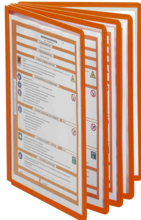
Couleur orange: pour les indications de service de produits toxiques