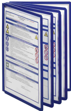
Couleur bleu foncé: pour les indications sur le fonctionnement des machines