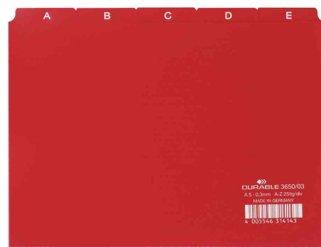
Répertoire A - Z, rouge