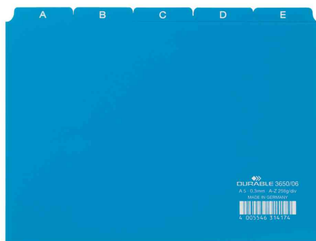
Répertoire A - Z, bleu