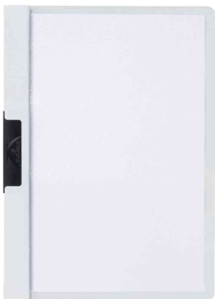
Chemise à clip DURACLIP® format A5, blanc