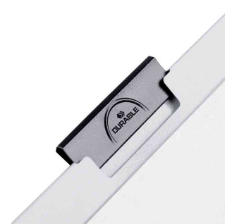
Pince noire extractible