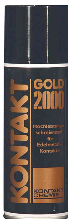
KONTAKT GOLD 2000