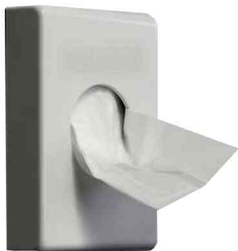
Distributeur de sachets hygiéniques