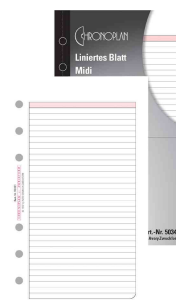
(3) Liniertes Blatt