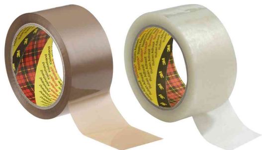
3M Ruban adhésif d'emballage Standard 371

Indication: recommandation de notre entreprise, car utilisé dans nos services