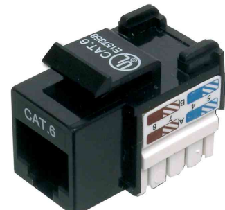
Keystone Jack Cat.6 E, non blindé