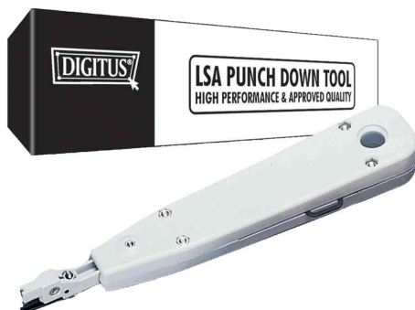
Accessoire, outil à sceller